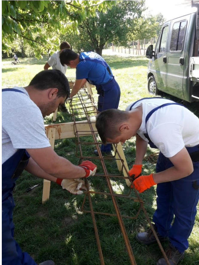
Wykonywanie zbrojenia pod fundamenty.