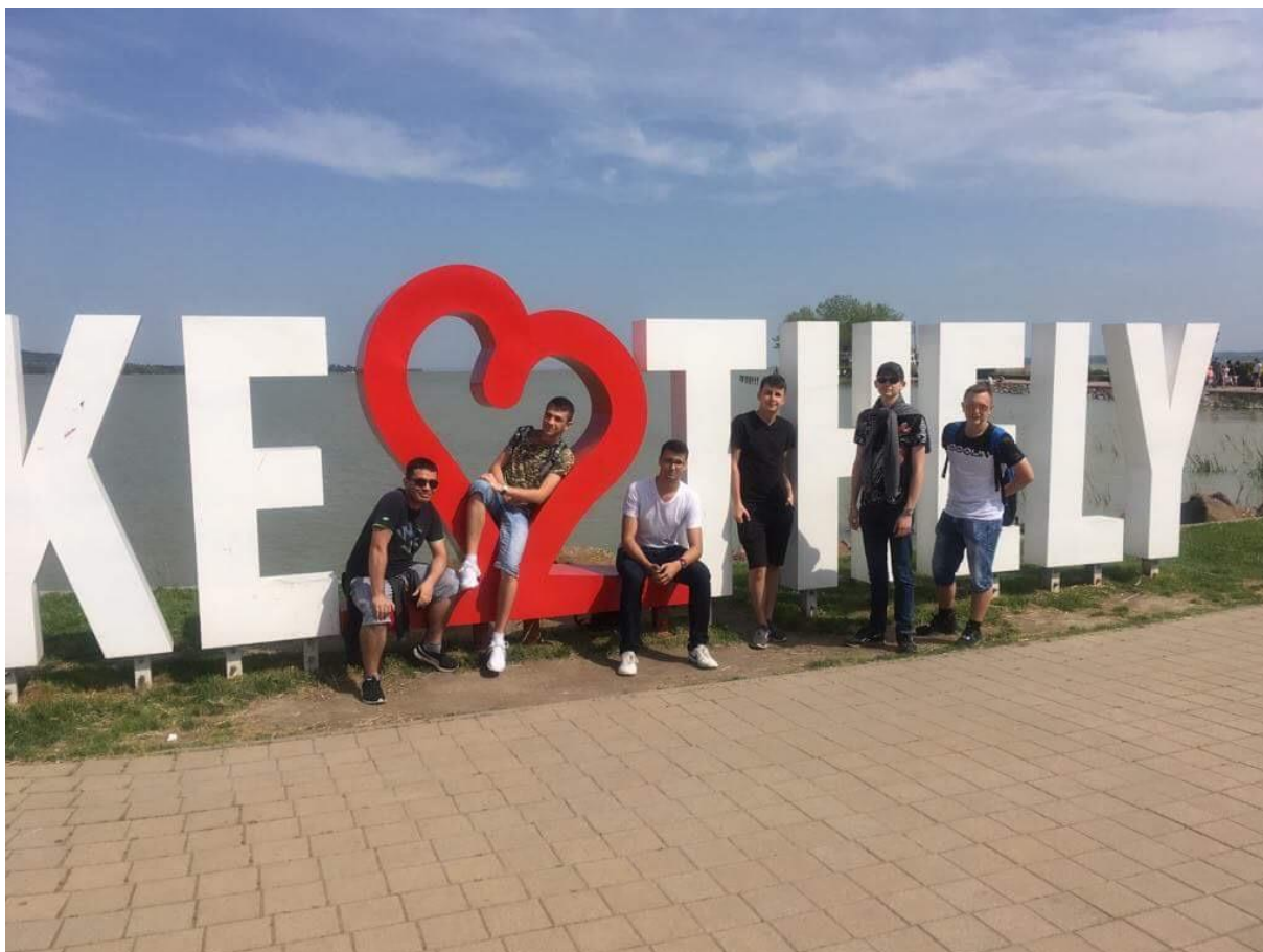
Uczniowie nad Balatonem.

W trakcie miesięcznego pobytu, uczniowie zetknęli się z niesamowitą otwartością i życzliwością ze strony lokalnej społeczności, nabyli umiejętności językowych i zawodowych, co w przyszłości pozwoli na podwyższenie kwalifikacji pokrywających się z profilem nauczania.