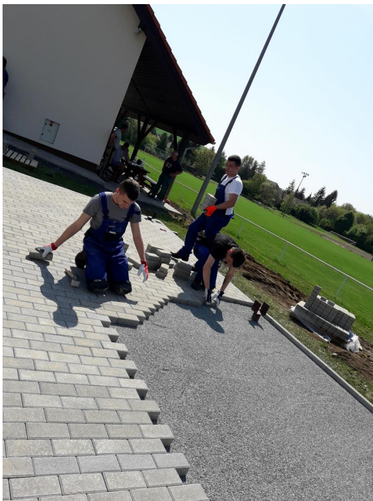
Układanie kostki brukowej