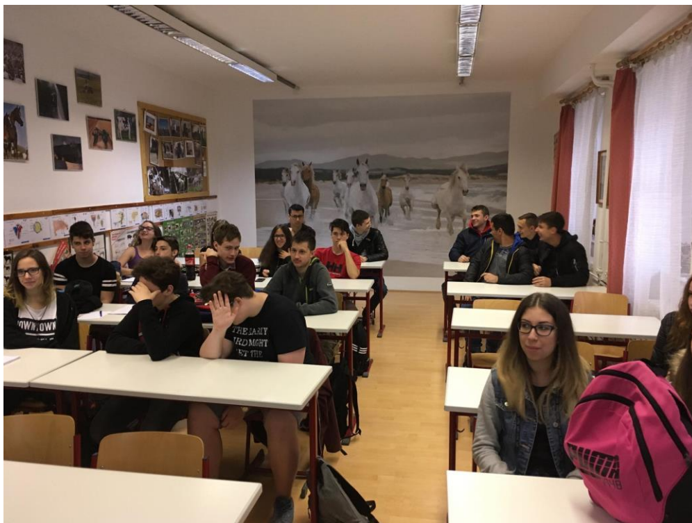
Uczniowie biorący udział w lekcji