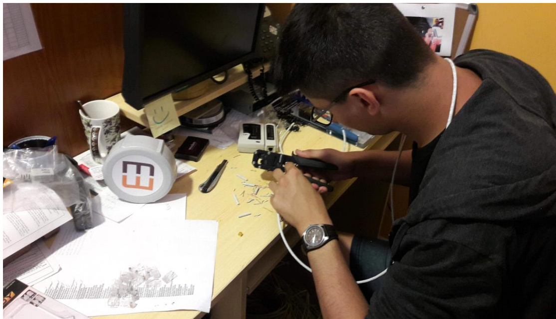
Tworzenie kabli połączeniowych 8P8C

Stażyci nabyli umiejętności z zakresu administracji serwerów, tworzenia kabli połączeniowych typu 8P8C, stron internetowych oraz konfiguracji urządzeń sieciowych. Ważnym aspektem podczas praktyk była komunikacja i kooperacja z pracownikami firmy. Uczniowie mieli okazję nauczyć się budowy, zasad działania anten internetowych oraz za pomocą specjalistycznych narzędzi i oprogramowania diagnozować oraz naprawiać ich usterki. Stażyci tworzyli również stronę internetową na rzecz projektu EULOCAL.